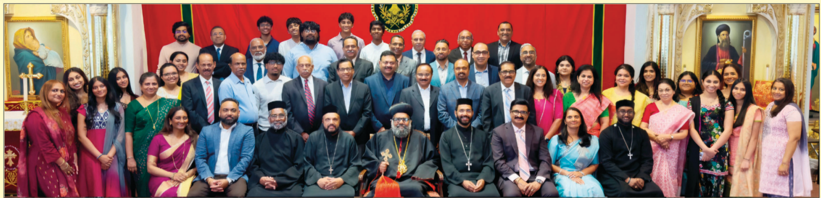
Conference General Committee

Conference Theme : "Vessels of Grace." 2 Timothy 2: 20-22