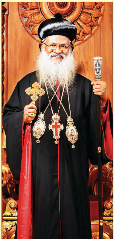
HH Baselios Marthoma Mathews III Catholicos & Malankara Metropolitan

Conference Theme : “Vessels of Grace.” 2 Timothy 2: 20-22